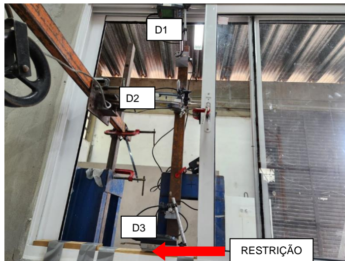
Figura 2 – Instrumentação de ensaio de resistência horizontal com um canto imobilizado

O método de ensaio é apresentado no Anexo G da ABNT NBR 10821-3:2017. É aplicada uma força de 400 N paralela à folha interna imobilizada da esquadria, no ponto médio do eixo vertical de seu perfil, e mede-se o deslocamento dos perfis. A esquadria não pode apresentar nenhum tipo de deterioração nos seus componentes ou elementos de fixação, colapso, fissura ou ruptura dos vidros. Além destes, a esquadria não pode apresentar deformação residual superior à 0,4% do comprimento livre do perfil em análise. A Figura 2 ilustra a instrumentação do ensaio.