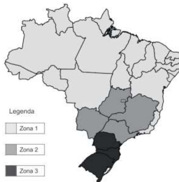
Figura 1 – Zoneamento climático brasileiro adotado para análise de desempenho térmico de esquadrias

Foram consideradas as três zonas climáticas brasileiras (1, 2 e 3) definidas pela mesma norma para análise do nível de desempenho térmico de esquadrias, conforme Figura 1. Os requisitos de desempenho são apresentados na Tabela 4, variando em função da quantidade de graus-hora de desconforto resultante do uso da esquadria, em cada uma das três zonas climáticas brasileiras.